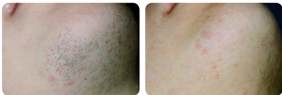
Pacjentka z zespołem wielotorbielowatych jajników - PRZED i PO licznych zabiegach