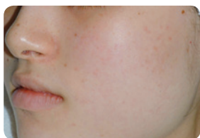
Trądzik różowaty - PRZED i PO 5 zabiegach