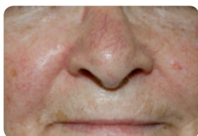
Naczynka wokół oczu - PRZED i PO 5 zabiegach