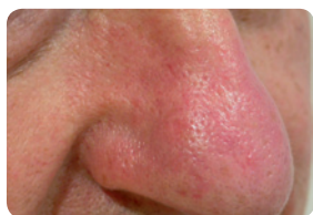
Trądzik różowaty - PRZED i PO 1 zabiegu